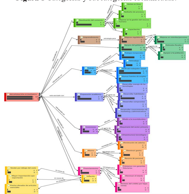
Figura 1 Categorías y subcategorías identificadas.

En la figura uno se puede observar que se identificaron nueve categorías principales: ahorro, apoyos del gobierno, emprendimiento, financiamientos, inflación, inversiones, preparación académica, reactivación del comercio y trabajo. De acuerdo con la percepción de los empresarios, estas categorías son los rubros en que se necesita implementar acciones para que pueda llevarse a cabo una recuperación económica postpandemia COVID-19. También como puede observarse en la figura uno, de cada una de las categorías se desprenden varias